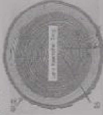
図2 二次形成部の形成