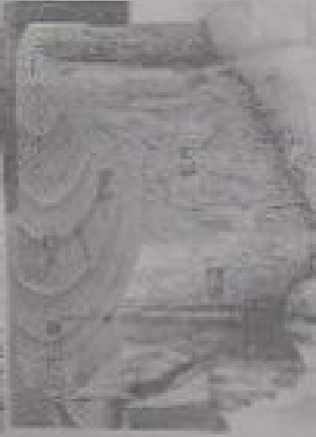
図1 木質部(二次形成部)の形成